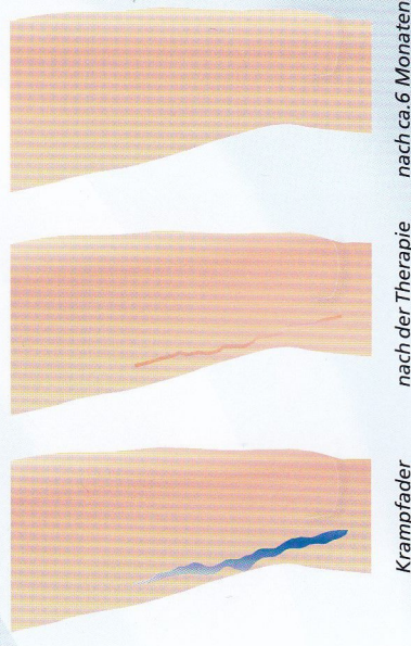
Verlauf nach der Laserung

Die gelaserte Vene wird vom Körper in natürlicher Weise aufgelöst, dieser Prozess dauert je nach Ausgangsgröße der Krampfader eine gewisse Zeit.